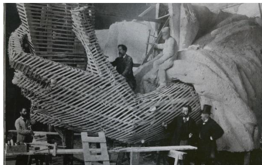
Image Une main de la statue

La structure a été construite et assemblée dans les ateliers de Levallois Perret, puis démontée et acheminée, par voie ferroviaire jusqu'à Rouen, puis, par voie maritime jusqu'à New York