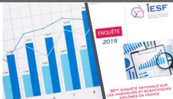
L'Enquête IESF 2019 est disponible

En version numérique ou en brochure, vous pouvez dès à présent commander notre 30ème enquête nationale sur la profession. En complément, nous vous proposons l'élaboration d'études ad-hoc (sur demande) et un module de calcul salaire en ligne.