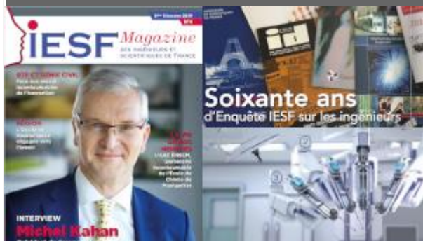
Parution du 4ème numéro d'IESF Magazine