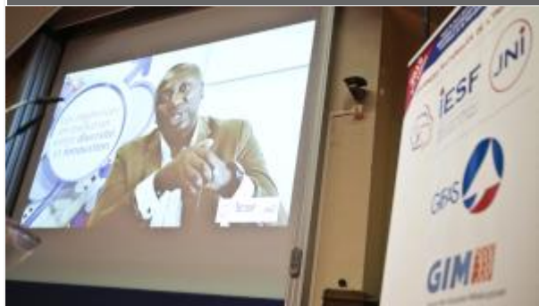
Bilan des JNI 2019

La notoriété des Journées Nationales de l'Ingénieur s'accroît d'année en année. La 6ème édition qui s'est déroulée en mars 2019 a rassemblé près de 14 000 participants de tous âges et tous horizons : grand public, professionnels et scolaires, dans toute la France et même au-delà.