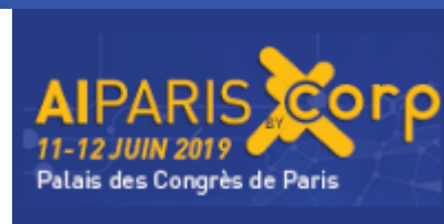
AI Paris 2019

Les 11 et 12 juin au Palais des Congrès de Paris se tiendra AI Paris 2019 ! IESF, via son Comité numérique, est partenaire de l'événement et vous permet de bénéficier d'un tarif réduit avec le code AIP19-IESF.