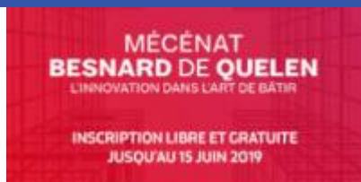
Prix Charles-Henri Besnard

IESF est partenaire de la Fondation du CNAM pour le Grand Prix Charles-Henri Besnard "l'innovation dans l'art de bâtir" et vous invite à envoyer vos candidatures avant le 15 juin 2019 !