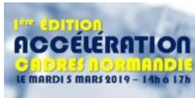
Accélération Cadres Normandie

IESF Normandie organise avec le MEDEF Normandie, Pôle emploi, la CCI Caen Normandie, la 1ère édition "Accélération Cadres Normandie" : une rencontre entre ingénieurs en évolution de carrière et entreprises qui recrutent. Venez rencontrer votre futur employeur le 5 mars de 14h à 17h à l'ENSI CAEN !