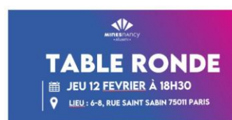
Table ronde : Regards croisés sur les enjeux du transport.

La Fondation Marius Lavet, dont IESF est partenaire, a remis le Prix Marius Lavet, ingénieur et inventeur, le 14 janvier à la Fondation des Arts & Métiers. L'occasion de mettre à l'honneur les parcours des cinq finalistes et leur engagement dans