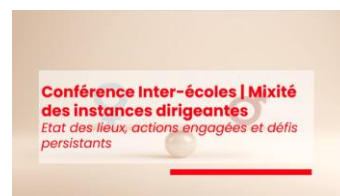
Table ronde G16+ : Mixité des instances dirigeantes Le 14

(CNAM) de Paris pour découvrir comment les dernières avancées des acteurs de L'Université Numérique et de France Université Numérique façonnent l'enseignement numérique. Cet évènement est ouvert à tous, que vous soyez professionnel de l'éducation ou non. Le thème sera "Souveraineté et pédagogie numérique". En savoir plus.