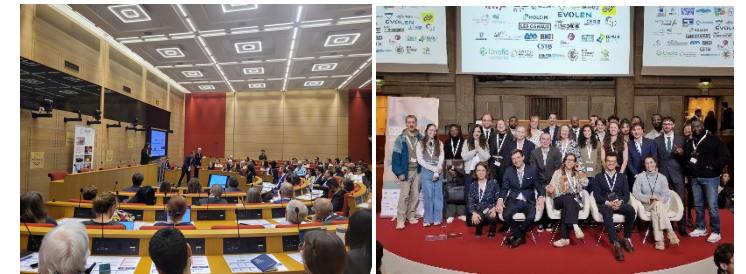
Remise du rapport au Sénat et au CESE - février 2026