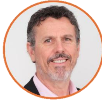
Nouveau Délégué Général