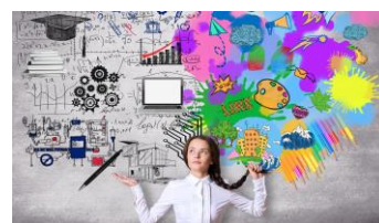
Agir pour corriger un constat alarmant : les